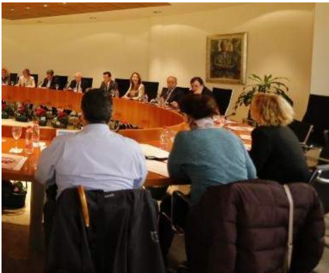
Reunión de los miembros del Consejo Social