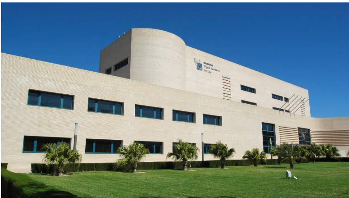
Edificio Rectorado y Consejo Social.

Según lo establecido en la Ley Orgánica 6/2001, de 21 de diciembre de Universidades, modificada por la Ley Orgánica 4/2007, de 12 de abril, se entiende delegada a las comunidades autónomas el poder regular su composición y funciones, dentro del marco establecido en la presente ley.